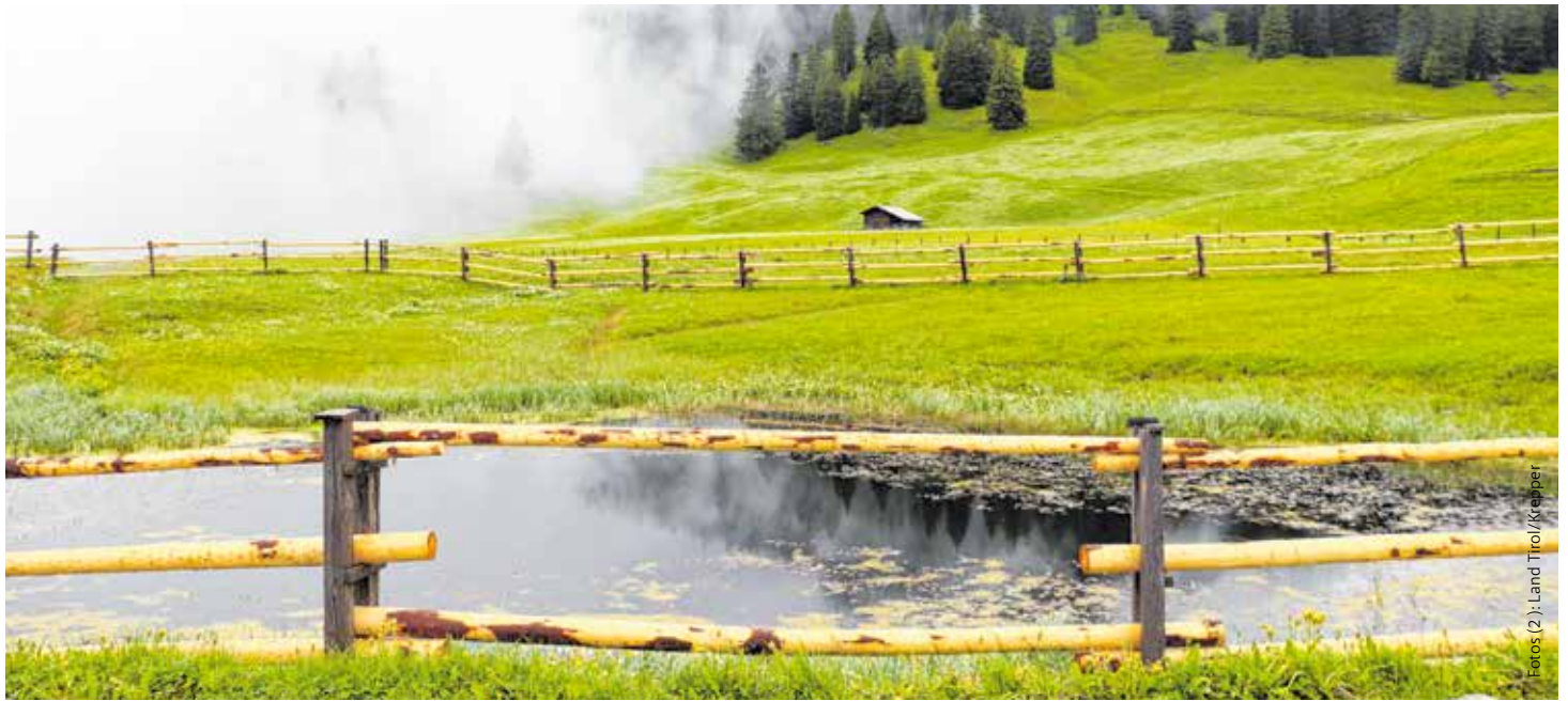
Schutz vor Veralgung: Abgrenzung der Walderalm-Teiche durch traditionelle Zäune aus Lärchenholz. Durch die traditionelle Bauweise können die Balken im Winter leicht abgebaut werden.