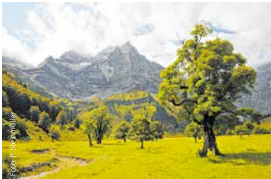
Großer Ahornboden im Naturpark Karwendel

Als größter und ältester der fünf Tiroler Naturparke sowie größtes Tiroler Naturschutzgebiet erstreckt sich der Naturpark Karwendel auf einer Fläche von 739 km 2 von der Leutasch bis zum Achensee. Der Naturpark Karwendel beheimatet unter anderem den Großen Ahornboden, den Isarursprung sowie die Hafelekar Spitze auf der Innsbrucker Nordkette und die Mondscheinspitze am Achensee.