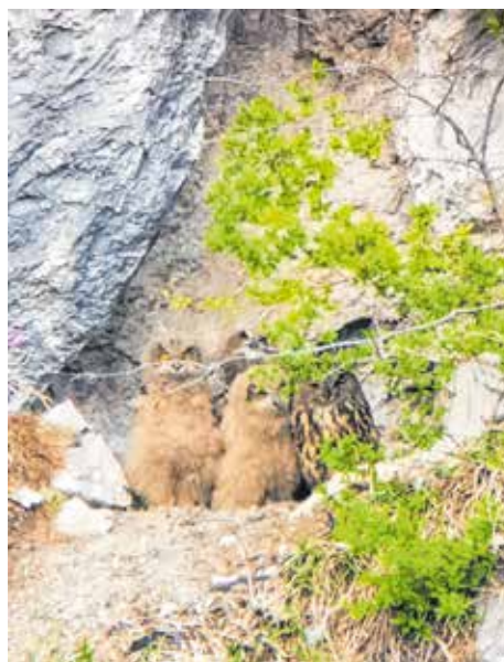
Eine Uhu-Familie in ihrem Horst.