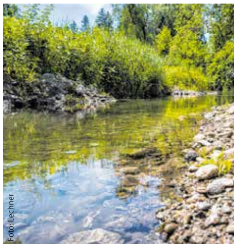
Durch die Renaturierung von Gewässern wird neuer Lebensraum für Tiere und Pflanzen geschaffen.

Wertvolle Gewässerabschnitte wurden in der Vergangenheit durch menschliche Eingriffe im Zuge von Verbauungen oder Begradigungen künstlich reguliert. Entsprechende Renaturierungsmaßnahmen sind daher dringend notwendig. So werden Auenflächen und Schotterbänke der Drau bei Nikolsdorf oder an den Ufern des Inns bei Zams und Tösens wiederhergestellt – und damit auch der natürliche Lebensraum für Flora und Fauna wie auch Erholungsraum für Menschen. Am Schlitterer Gießen im Zillertal zeigen sich schon erste Erfolge, denn dort wurden bereits wenige Monate nach der