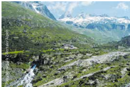
Berliner Hütte im Naturpark Zillertaler Alpen

Das Ruhegebiet Zillertaler Hauptkamm wurde mit dem umliegenden Schutzgebiet des Tuxer Hauptkamms verbunden und erstreckt sich auf einer Fläche von 422 km 2 . Hier finden sich grüne Täler und atemberaubende Almen sowie tiefe Schluchten, imposante Gletscher und zahlreiche Dreitausender wie der Hochfeiler, wodurch der Naturpark auch die Bezeichnung „Hochgebirgs-Naturpark Zillertaler Alpen“ erhielt.