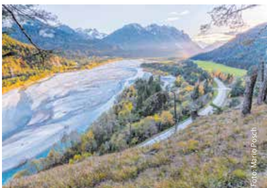
Der Lech im Naturpark Tiroler Lech

Als kleinster der fünf Naturparke mit rund 42 km 2 hat die wilde Flusslandschaft des Tiroler Lech als eines der letzten naturnah erhaltenen alpinen Flussgebiete Österreichs einiges zu bieten. Der Wildfluss ist die Lebensader einer einzigartigen Landschaft mitten im Außerfern. In den angrenzenden Wäldern sowie den Bächen der Seitentäler findet sich eine bunte Vielfalt an Pflanzen und Tieren im und um den Tiroler Lech.