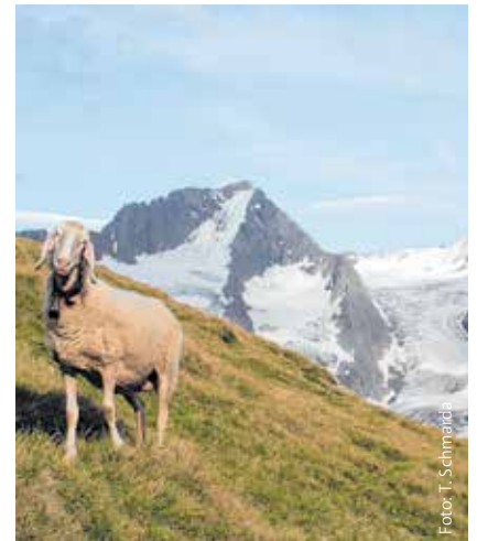
Hohe Mut im Naturpark Ötztal

Der Naturpark Ötztal erstreckt sich vom Talboden bis hinauf in das hochalpine Gletschergebiet im hinteren südlichen Ötztal. Auf einer Fläche von 510 km 2 beherbergt der Naturpark 67 imposante Gletscher sowie ausgedehnte Gletscherfelder und Gletscherzungen. Mit 3.774 Metern liegt auch die Wildspitze als zweithöchster Berg Österreichs mitten im Ötztaler Naturpark.