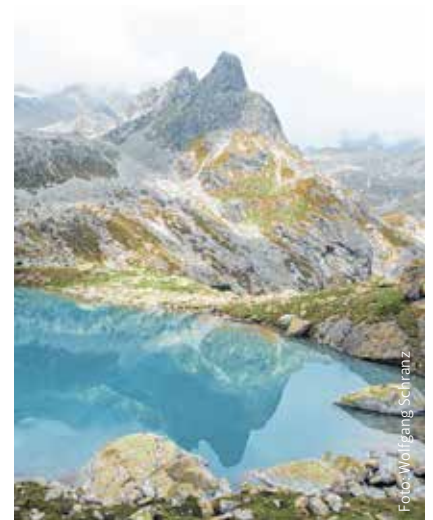
Mittelbergsee im Naturpark Kaunergrat

Von der Tallandschaft bis ins Hochgebirge erstreckt sich der namensgebende Gebirgszug Kaunergrat zwischen dem Pitztal und dem Kautental. Auf 240 km 2 verbindet der Naturpark abwechslungsreiche Lebensräume miteinander, die von feuchten Mooren und alpinen Trockenwiesen bis hin zu atemberaubenden Gebirgslandschaften reichen, in denen eine riesige Artenvielfalt zu bestaunen ist.